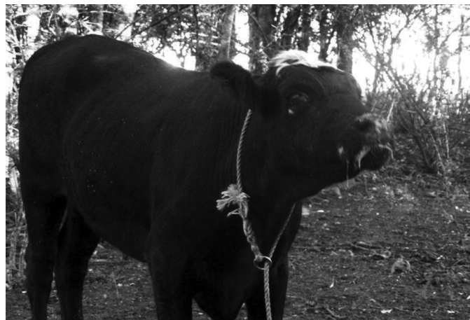
Fig.1. Bovino macho com depressão, opacidade corneal bilateral, fotofobia, secreção nasal e ocular mucopurulenta.

Os achados de necropsias caracterizam-se por opacidade da córnea e conjuntivite, lesões inflamatórias erosivas, necróticas e ulcerativas das mucosas do trato respiratório e digestivo (narinas, cornetos nasais, gengivas, palato, língua, faringe, esôfago, traquéia, abomaso e intestinos), linfadenomegalia, enterite catarral, congestão e edema pulmonar, focos esbranquiçados de aproximadamente 3mm de diâmetro