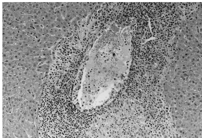
Fig.2. Hepatite com vasculitis necrotizante fibrinoide em bovino. HE, obj.20x.

distribuídos na superfície e no interior do parênquima dos rins e fígado, áreas de congestão a nível do endocárdio. Também foram observadas hemorragias generalizadas, inflamação purulenta dos órgãos respiratórios, áreas de consolidação pulmonar, coleção de abundante líquido sanguinolento/hemopurulento nas cavidades pericárdica e abdominal, presença de lesões erosivas longitudinais com desprendimento parcial da mucosa e formação de pseudomembranas no nível da cavidade bucal, esôfago e reto, artrite nos membros anteriores e posteriores e hemorragias na base do encéfalo.