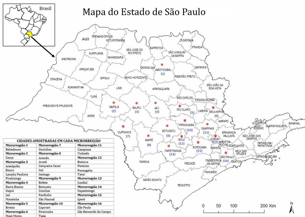
Fig.1. Mapa temático com as 16 Microrregiões geográficas (*) e das 37 cidades (quadro em destaque) que tiveram amostras colhidas para verificar a ocorrência do SNP c.767G>T no gene DNM1 em cães da raça Labrador Retriever.

A ocorrência de animais E/E e E/N foi de 3,4% (11/321) e 24,6% (79/321), respectivamente. O restante dos animais (72,0%, 231/321) não possuía este SNP (wild type). Utilizando a PCR seguida de restrição enzimática, Patterson et al. (2008) genotiparam cerca de 400 cães da raça Labrador Retriever de 22 estados americanos e três estados canadenses e observaram que a frequência de animais E/E e E/N foi de 3% e 37%, respectivamente. Usando esta mesma técnica, Minor et al. 2011, genotiparam 860 Labradores Retrievers dos EUA e Canadá e observaram a ocorrência de