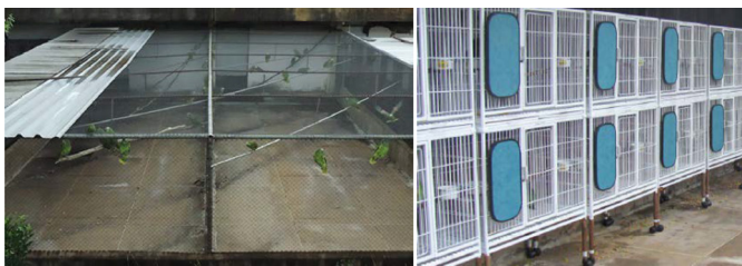
Fig.2. (A) Viveiros adjacentes onde os animais permanecem em grupos, separados por sexo. (B) As gaiolas onde os animais foram isolados (B).