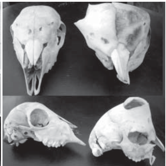
Fig. 8. Diversas malformações da cabeça do Cordeiro 6: micrognatia, aplasia bilateral do osso incisivo, palatosquise e malformação da órbita.