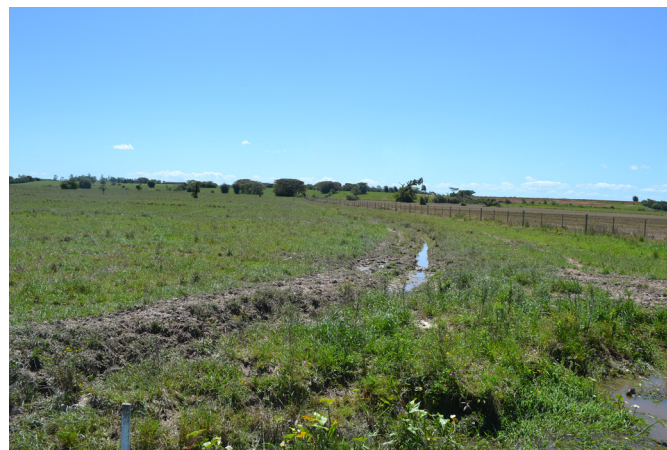
Fig.1. Leptospirose em bezerros criados em resteva de arroz (pallhada ou restos culturais de lavoura) de arroz com áreas alagadiças em que estavam os bezerros afetados.

No exame macroscópico, a cavidade torácica do Bezerro A estava repleta de líquido avermelhado. Nos Bezerros A, B