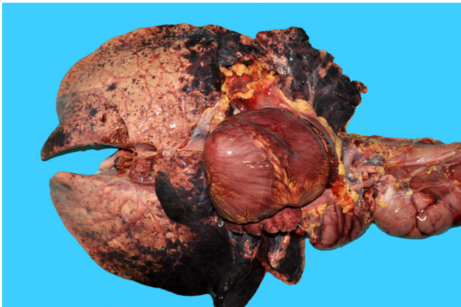
Fig. 3. Leptospirose em bezerros criados em resteva de arroz. Necropsia do Bezerro A. Pulmões com hemorragias multifocais a coalescentes, mais acentuadas em lobos craniais.