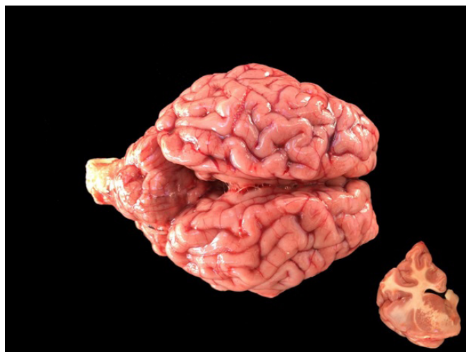
Fig.1. Babesiose cerebral em bezerros. CórTEX telencefálico e cerebelo com marcada coloração vermelho-cereja. No detalhe evidencia-se coloração vermelho-cereja da substância cinzenta do encéfalo.

Histologicamente havia congestão, eritrofagocitose e hemossiderose no baço. No fígado havia congestão e necrose centrolobular. Os rins estavam congestionados e havia nefrose hemoglobinúrica. O SNC estava acentuadamente congestionado e nos capilares cerebrais havia numerosas hemácias parasitadas com um ou dois parasitas basofílicos que mediam menos de 1µm cada.